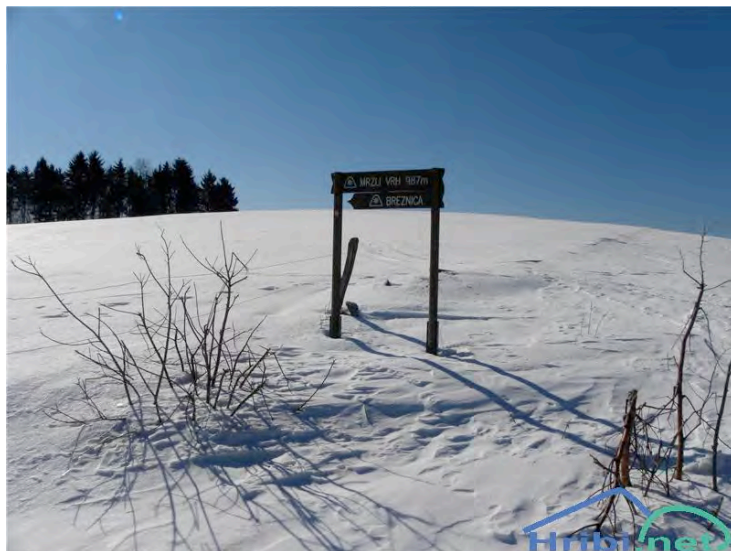
Vrh Mrzlega vrha ali Loncmanove Sivke