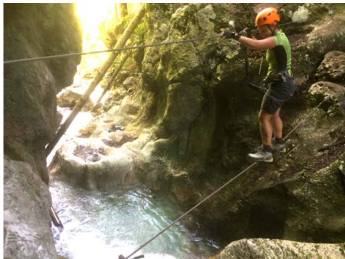
Na ferati Hvadnik