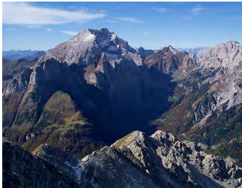
Najvišji vrh Karnijcev – Mt. Coglians s Polinika

RAZGLED: Z vrha Cogliansa, na katerem stoji križ in zvonec, je čudovit razgled po celotnih Karnijskih Alpah, v lepem vremenu pogled seže vse do Julijskih Alp s Triglavom, Lienških Dolomitov, in celo do Ankogla in Marmolade ter seveda vseh čudovitih vmesnih planin in gora.