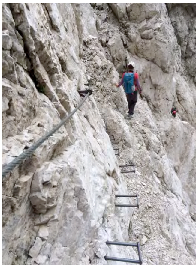
Zelo zahtevna pot skozi Turski žleb