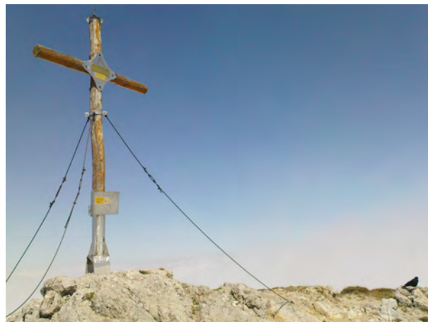
Najvišji vrh Košute: Košutnikov turn, foto Zdenka M