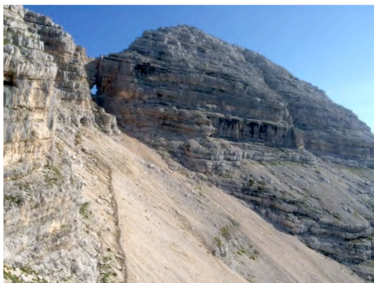
Prestreljeniško okno, Prestreljenik in police s ferato, foto ZM