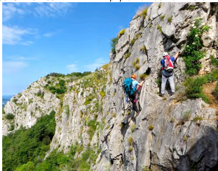
Razgledna ferata Bruno Biondi

I. del: Preplezali bomo tri ferate , najdaljšo med njimi, ki so jih tržaški alpinisti nadelali za potrebe učenja gorniškega gibanja po tovrstnih poteh, se imenuje Bruno Biondi in leži v severnem delu doline, bolj vzhodno, na zahodni strani, v Čički steni, pa sta smeri Zimska roža/Rose d'Inverno in Nos/Naso , ki ju bomo prav tako preplezali.