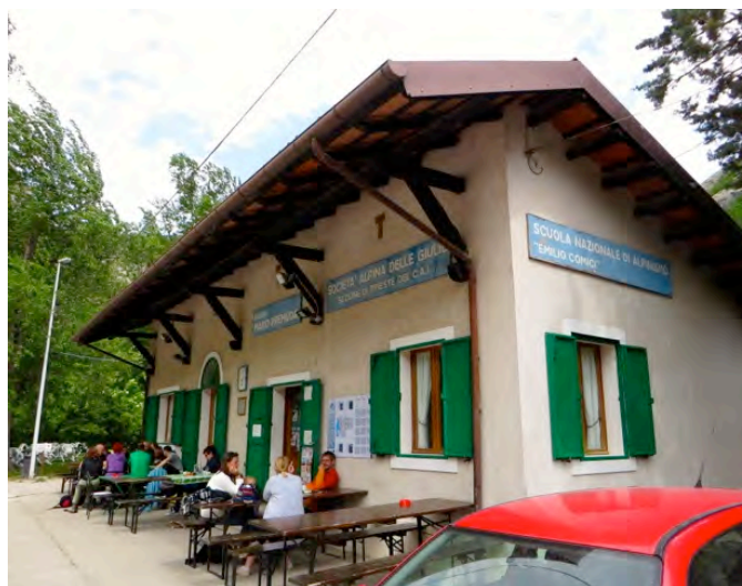
Koča Mario Premuda