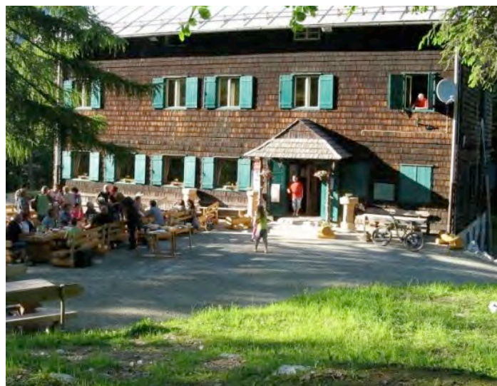
Dom pod Storžičem, arhiv splet