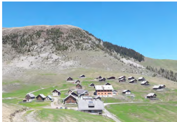
Bistriška planina z Ojstrnikom v ozadju