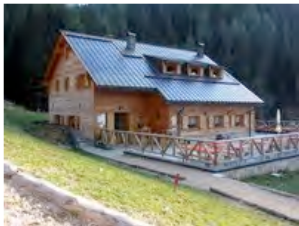
Nova koča Nordio-Deffar, arhiv splet