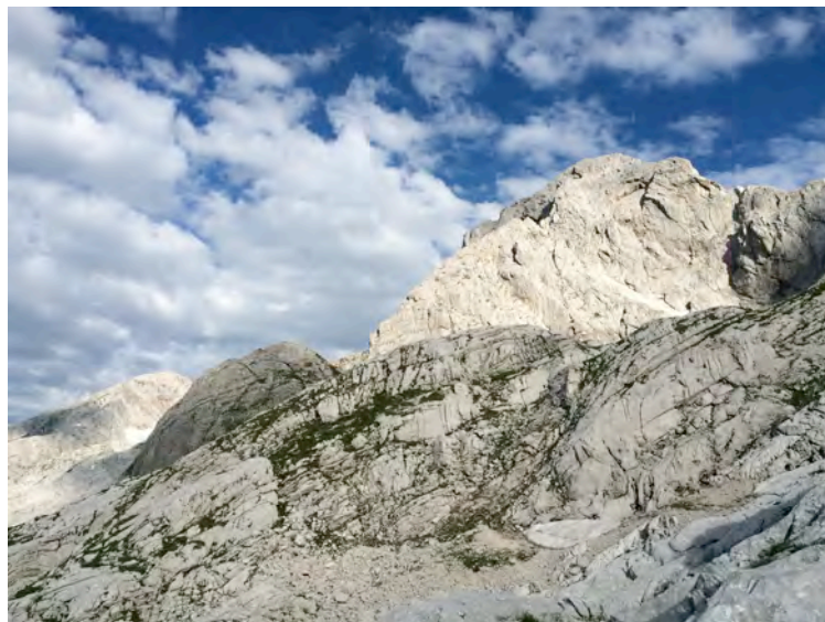
Skuta in levo špica Grintovca od Bivaka pod Skuto