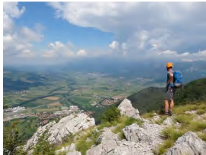
Razgled na Vipavsko z Gradiške Ture

A (trening tura za zelo zahtevne planinske poti): Gradišče (250 m)–Furlanova pot–Trikot–spust po Furlanovi poti–Furlanova pot–Gradiška Tura (793 m)–Trikot–zahtevna pot–Gradišče (250 m).