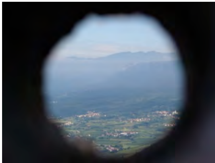
Razglednica Vipavske skozi luknjo v skali na Furlanovi poti