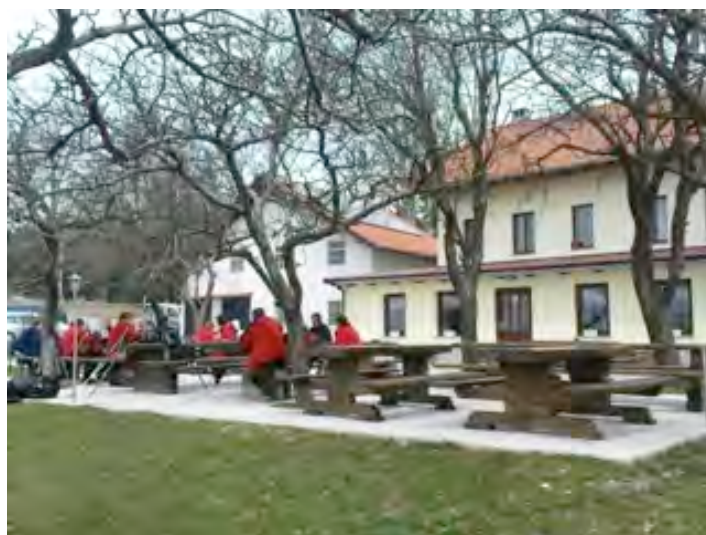
Pri Furlanovem zavetišču pri Abramumu