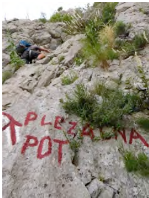
Začetek Furlanove poti

Skupini A in B bosta od izhodišča pri Kampu Tura nad Gradiščem nekaj časa hodili skupaj, nato pa se bosta ločili.