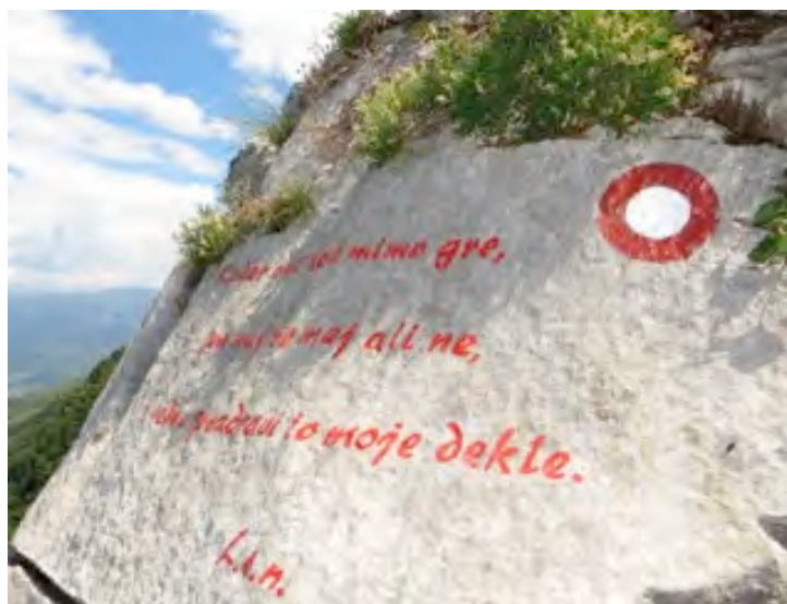
Napis tik pod vrhom Gradiške Ture