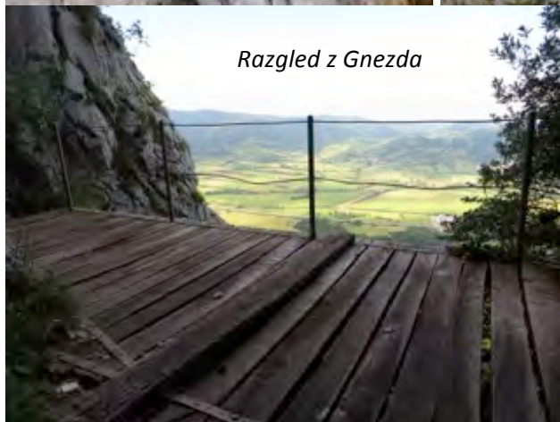
Razgled z Gnezda