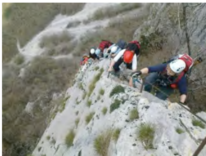
Atraktiven greben na Furlanovi poti