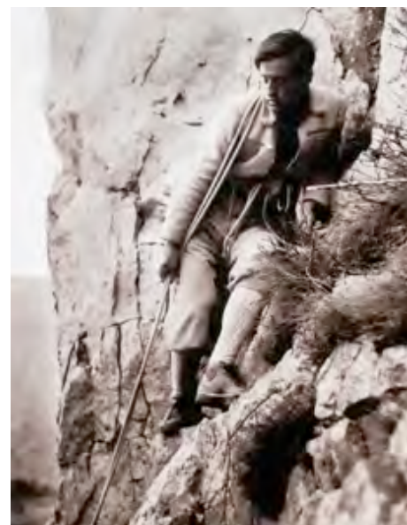
Emilio Comici, ki je še pred II. svetovno vojno na tem območju ustanovil plezalno šolo. V koči Rifugio Mario Premuda, do katere bomo šli na tem pohodu, ima svojo spominsko sobo, v Sekstenskih Dolomitih pa tudi »svojo« kočo Rifugio Comici, ki jo bomo obiskali letos poleti.