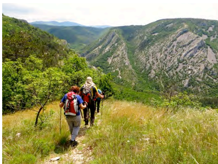
Čudoviti razgledi in mehka pot, foto ZM