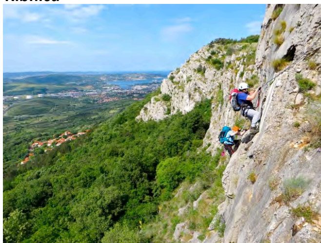
Razgledna ferata Bruno Biondi