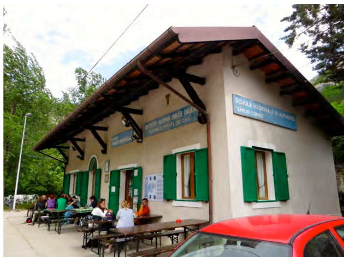
Koča Mario Premuda