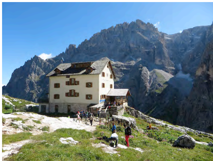
Kočica Comici/ Zsigmondy Hütte nad dolino Bacherntal, na drugi strani vrhov Cima Undici in Zsigmondykopf, foto Zdenka M.